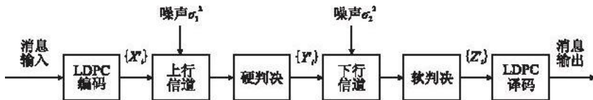
图 2 星上再生转发卫星通信模型

本文研究再生转发卫星通信中的 LDPC 译码算法, 要求在星上不进行译码和编码, 根据该要求可以建立图 2 所示的星上再生转发卫星通信模型。