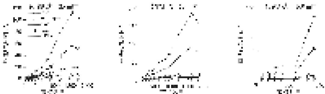
图 4 不同节点传输距离下算法收敛时间