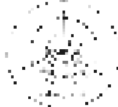
图 2 WSN 无线广播扩散过程 Fig. 2 WSN multihop propagation