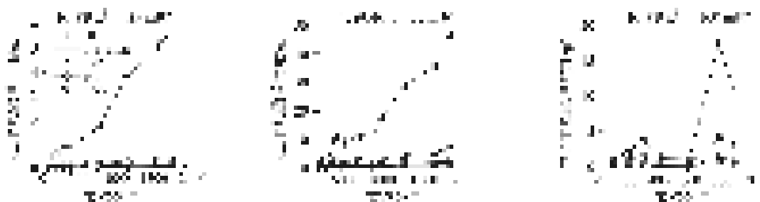
图 5 不同传输距离下算法节点平均能耗