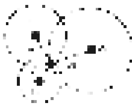
图 1 3 边测量节点定位方法 Fig. 1 Trilateration technique

3 边测量是一种常用的 WSN 网络节点定位方法,其原理如图 1 所示,它用多个锚节点与目标节点之间的距离来计算目标节点的物理坐标位置 [9] 。WSN 中无线广播信息的扩散过程如图 2 所示,一个以信息发出点为圆心的多个环形区域,如图 3 所示,类似 3 边测量任意一个区域 P 的位置将由距离 3 个已知节点( A_1, A_2, A_3 )的跳数唯一确定,而且区域 P 的大小是一跳通信距离。基于以上分析,算法假设 WSN 中存在有限个(至少 3 个)全局可识别的节点,称为 sink 节点,网络中的所有节点(包括 sink 节点)对将要组建的网络结构是完全无知的,除 sink 节点外网络中其它节点没有全局唯一的身份标识。节点 ID 分配算法的基本思想是由 sink 节点广播消息发起算法,接收到消息的节点记录自己所处层次的跳数并转播扩散,再根据节点自身所处层次位置选择所属主 sink 节点(Master sink)并计算出节点 ID,根据节点与 sink 节点之间的隶属关系建立 sink 节点的管理域(以 sink 节点为中心,所有隶属于该 sink 节点的字节节点覆盖的区域称为该 sink 节点的管理域),由 sink 节点负责管理域内所有的节点得到域内唯一的 ID,节点 ID 由 2 部分组成:sink 节点 ID 和域内部 ID。下面算法实现过程中只需要继续讨论如何获得域内部节点 ID。