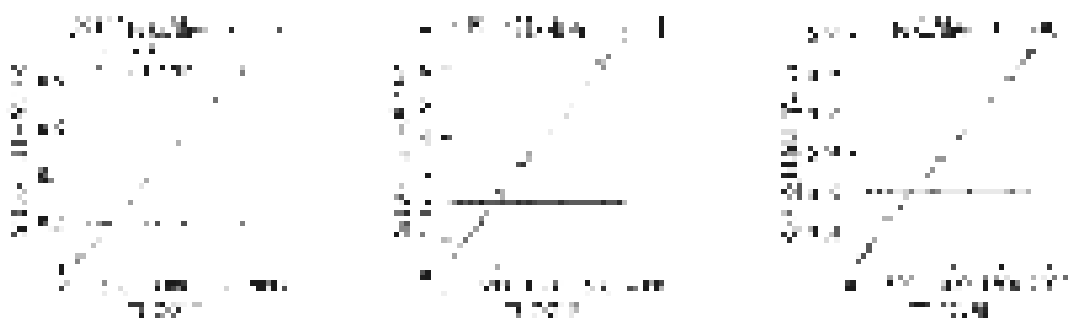
图 6 不同传输距离下算法命名空间利用率