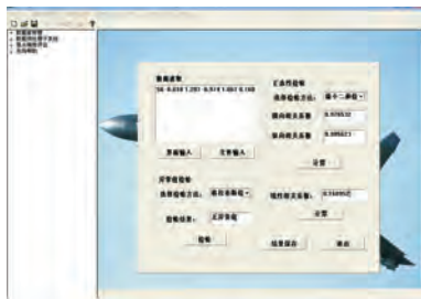
图 3 数据处理界面